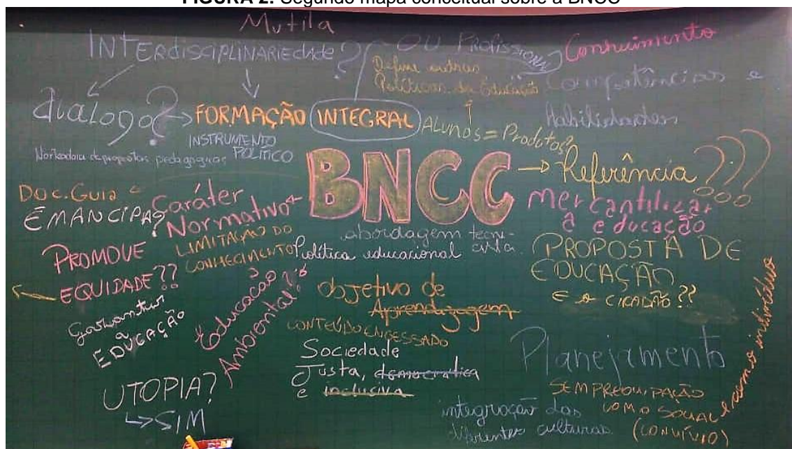
FIGURA 2: Segundo mapa conceitual sobre a BNCC