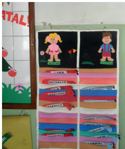
Imagem 4. Sala de aula. Pré-Escola T. Tadeu da Silva.