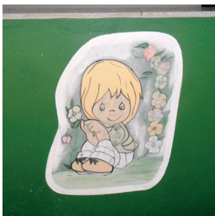
Imagem 17. Área interna. Pré-Escola Michel Foucault.

Se o cartaz indica o espaço da cozinha, a ilustração é de uma cozinheira (Imagem 18), no máximo, ruiva. Abriremos um parêntese aqui. Se a escola tivesse cozinheiras louras e ruivas e colocasse a imagem de uma mulher negra, poderíamos cair no discurso estigmatizado de que a pessoa negra está relacionada aos afazeres domésticos, trabalho tido como inferior. Mas, nesse caso, em que as cozinheiras são, de fato, negras (pretas e pardas), e a gravura é de uma mulher ruiva, branca. Continuamos, portanto, sem a representação da figura do negro nas escolas. Isso é o normal.