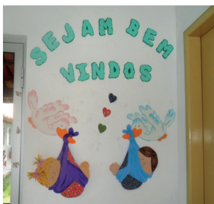
Imagem 8. Porta da sala. Pré-Escola Stuart Hall.

Se os cartazes indicam o espaço onde a criança faz as suas refeições cotidianamente (Imagem 9), a imagem utilizada é de uma criança loura. Isso é o normal. Nesta creche, só temos uma criança que poderia ser declarada como branca (cabelos louros, olhos azuis); as demais são negras.