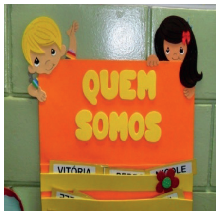
Imagem 12. Sala de aula. Pré-Escola Mariano Narodowski.

Se o cartaz indica a divisão de uma turma em meninos e meninas (Imagem 12), a ilustração é de crianças com características de pessoas brancas: menino louro e menina de cabelos castanhos, mas com características fenotípicas de pessoas brancas. Isso é normal.