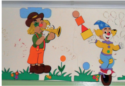
Imagem 10. Sala de aula. Pré-Escola Michel Foucault.

Ao representar uma bailarina na parede da escola, ou algo relacionado aos aspectos circenses (Imagens 10 e 11), como o palhaço, por exemplo, o fazem com personagens louros. Isso é o normal.