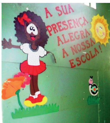
Imagem 3. Parede da área interna. Escola Thomas Skidmore.

E quando é exibida a figura de uma criança de cor preta, ela aparece de forma caricaturada, com os olhos em tamanho exagerado, como na Imagem 3.