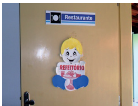
Imagem 9. Porta do refeitório. Creche Moysés Kuhlmann Jr.

Se os cartazes indicam o espaço onde a criança faz as suas refeições cotidianamente (Imagem 9), a imagem utilizada é de uma criança loura. Isso é o normal. Nesta creche, só temos uma criança que poderia ser declarada como branca (cabelos louros, olhos azuis); as demais são negras.