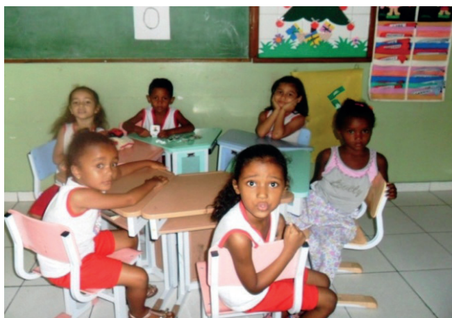
Imagem 5. Sala de aula. Pré-Escola T. Tadeu da Silva.

Deparamo-nos cotidianamente com situações que promovem o desenvolvimento e a manutenção de racismo e de discriminação nas instituições educativas, ao imporem as diferenças fenotípicas como superiores ou inferiores, como mais belas ou menos belas. Tudo isso se constitui num discurso de poder,