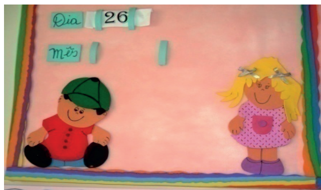
Imagem 15. Sala de aula. Creche Maria Bujes.

Se o cartaz é para o acompanhamento diário do calendário (Imagem 15), o louro tem de estar presente. Ele não pode faltar em nenhuma das exposições, pois, como vimos, ele é o centro, o grupo racial de referência. Isso é normal.