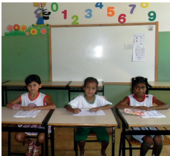
Imagem 6. Sala de aula. Escola Thomas Skidmore.

Na Imagem 6 constatamos a invisibilidade do corpo negro na decoração e a visibilidade do corpo negro entre as alunas, contribuindo para a exclusão ou a normalização da pessoa negra no espaço escolar. As crianças já acostumaram ou adestraram o olhar. Já não se veem como parte da escola. Se elas são inferiores, para que ter imagens de crianças negras nas paredes das escolas. Para enfeá-las?