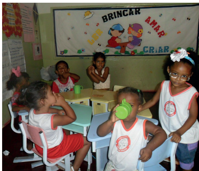
Imagem 1. Sala de aula. Escola Avtar Brah.

Não faz muito tempo, fui comprar esse material (E.V.A. ou emborrachado) e, quando comecei a pedir as cores que queria, a funcionária que me atendeu perguntou se eu iria levar o “cor de pele”. Não me contive e perguntei: “Cor da pele de quem?”. Naturalizou-se que a cor da pele é clara, branca, e não, escura, preta.