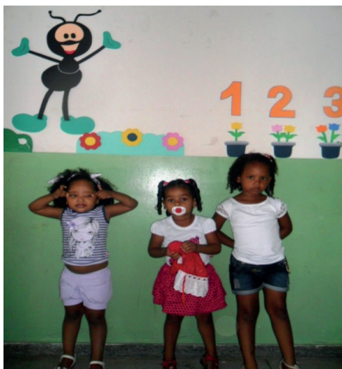
Imagem 2. Sala de aula. Creche Maria Bujes.

Na Imagem 2, há uma formiga, conhecida como Smilinguido 9 e uma completa invisibilidade da representação de pessoa negra, uma eliminação da sua presença na decoração do espaço educativo, embora haja um grupo de crianças negras, como as que estão posicionadas à frente da imagem, nas instituições pesquisadas.