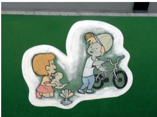
Imagem 16. Área interna. Pré-Escola Michel Foucault.