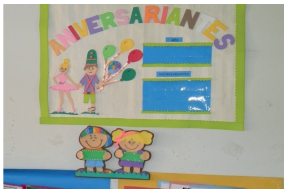
Imagem 13. Secretaria. Creche Fúlvia Rosemberg.

Se o cartaz é para parabenizar ou indicar o aniversariante da semana (Imagens 13 e 14), os personagens são brancos/as, e duas crianças brancas carregam os crachás com os nomes das crianças – menino e menina. Isso é normal.