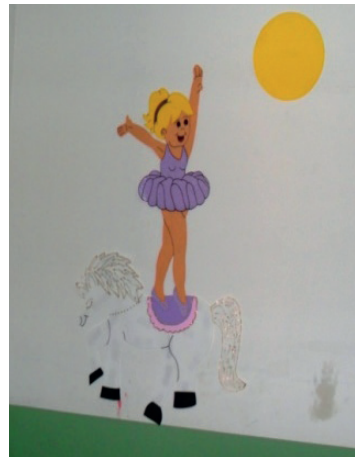
Imagem 11. Sala de aula. Creche Fúlvia Rosemberg.

Se o cartaz indica a divisão de uma turma em meninos e meninas (Imagem 12), a ilustração é de crianças com características de pessoas brancas: menino louro e menina de cabelos castanhos, mas com características fenotípicas de pessoas brancas. Isso é normal.