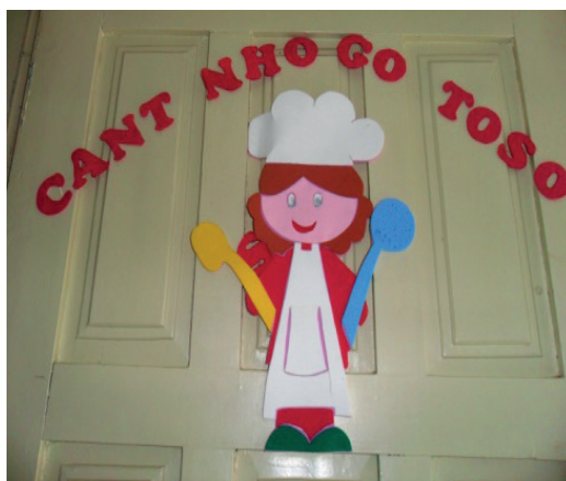
Imagem 18. Porta da Cozinha. Creche Fúlvia Rosenberg.

Se o cartaz indica o espaço da cozinha, a ilustração é de uma cozinheira (Imagem 18), no máximo, ruiva. Abriremos um parêntese aqui. Se a escola tivesse cozinheiras louras e ruivas e colocasse a imagem de uma mulher negra, poderíamos cair no discurso estigmatizado de que a pessoa negra está relacionada aos afazeres domésticos, trabalho tido como inferior. Mas, nesse caso, em que as cozinheiras são, de fato, negras (pretas e pardas), e a gravura é de uma mulher ruiva, branca. Continuamos, portanto, sem a representação da figura do negro nas escolas. Isso é o normal.