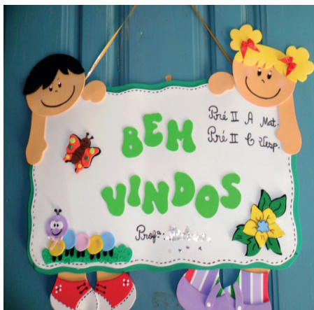
Imagem 7. Parede. Creche Moysés Kuhlmann Jr.

Destacaremos, a seguir, as marcas do poder da “normalidade”, propagadas pelos cartazes nas instituições pesquisadas. Vejamos: Se as escolas põem placas de boas-vindas nas portas das salas (Imagens 7 e 8), elas são representadas com figuras de crianças brancas. Isso que é normal.