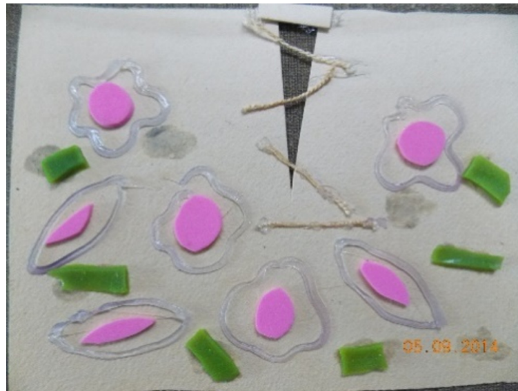
Figura 2. Representação da fase proliferativa do processo de cicatrização (modelo em papel Paraná). Estrutura verde (parafina em gel): vasos sanguíneos em maior número em relação à primeira fase; Relevo em cola quente (limite das células: macrófagos e fibroblastos) e estrutura rosa em E.V.A. (núcleo redondos – macrófagos; núcleos achatados - fibroblastos); linha de bordar (fibras colágenas finas desorganizadas); corte da pele em processo de fechamento com o mesmo material do modelo (repitelização)