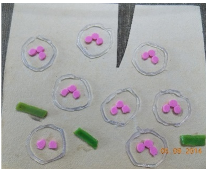
Figura 1. Representação da fase inflamatória do processo de cicatrização (modelo em papel Paraná). Estrutura verde (parafina em gel): vasos sanguíneos; Relevo em cola quente (limite das células) e estrutura rosa em E.V.A. (núcleo segmentados dos neutrófilos)

Para a fase de remodelação/maturação foi selecionada a representação da redução do infiltrado de macrófagos e fibroblastos e dos vasos sanguíneos; a retração do corte quase completa; a substituição e reorganização das fibras colágenas (Figura 3).